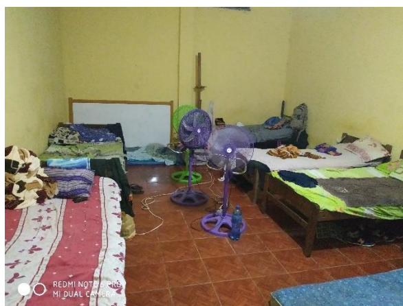
Dormitorio policial acomodado como celda de detención de 8 policías imputados

A Hrs. 19:45 aproximadamente, se procedió a tomar testimonios en los dormitorios policiales, adecuados para servir como celdas de los 8 servidores policiales imputados en el proceso de violación de la peticionaria. Si bien dicho espacio era mucho más grande que las celdas de la población común (8x4m. Aprox.), contaba con 6 catres y 2 colchones, y varios ventiladores, de todos modos es caliente y huele mal.