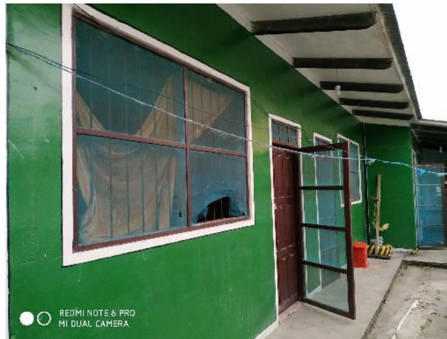
Exterior de la celda de mujeres.

pusieron. (...) con lo que ha pasado (...) a raíz de la denuncia de E.C.A., entonces es entendible que todos los policías, hombres y mujeres estén molestos o estén susceptibles de todo lo que pueda pasar. Con lo que han puesto más reglas, mayor seguridad, algunas nos decían, apúrense en el baño que no es toda la tarde, digamos, cuando siempre acostumbramos a bañarnos y hacer nuestras necesidades, ¿no? Después un rato de eso le dije a mi amiga “apúrate, que no es toda la tarde” (...) Ya con eso la policía se alteró. “Se está haciendo la burla de la policía cuando le dijo así”. Entonces le dije que no, que estábamos bromeando, que podíamos reír y me callé, ella siguió hablando, me callé para no alterar más la situación porque me puse a pensar que es entendible que ellos (...) Sólo me decía ella [la peticionaria] que la maltrataban, que estaba un año y otras cosas más pero nunca me dio nombres. Nunca me dijo, me siento así, asá. A raíz de eso ella habló, lo hizo público y yo, cuando vienen las visitas recién me entero qué es lo que ha pasado (...) E.C.A es un poco reservada también en sus cosas, me dice ella “No te voy a contar, porque de repente tú lo cuentas, porque sólo yo sé lo que es sufrir, tú no sabes nada, tú no sabes nada. Solo yo sé lo que he sufrido y esperé el momento en que yo pueda decir toda la verdad y que se haga justicia para mí”. Es lo único que ella me dice.” 2