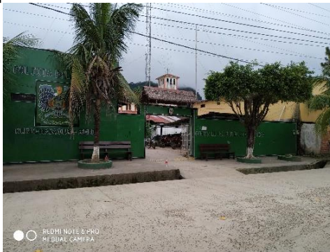
Frontis del Comando de la Policía de Rurrenabaque.

El 16 de marzo del año en curso, personal de la Defensoría del Pueblo, se constituyó en el Comando de la Policía de Rurrenabaque con el objetivo de obtener testimonios sobre los hechos investigados en el presente caso.