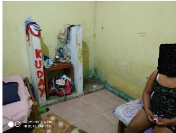
Celda de mujeres

Es importante señalar que, en la inspección realizada en la celda de mujeres, se evidenciaron dibujos realizados por la peticionaria en las paredes: