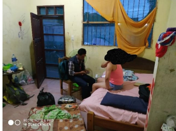
Celda de mujeres

DEFENSORÍA DEL PUEBLO ESTADO PLURINACIONAL DE BOLIVIA