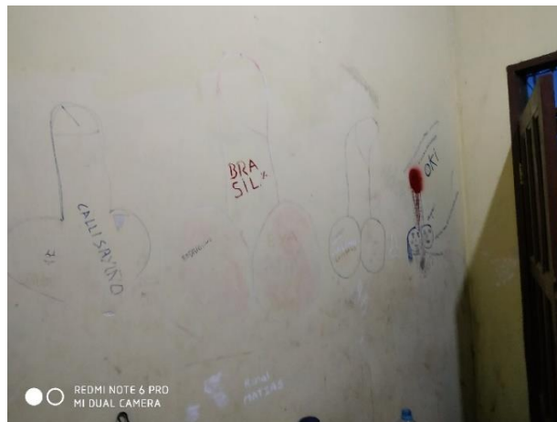
Dibujos y anotaciones de ECA

Es importante señalar que, en la inspección realizada en la celda de mujeres, se evidenciaron dibujos realizados por la peticionaria en las paredes: