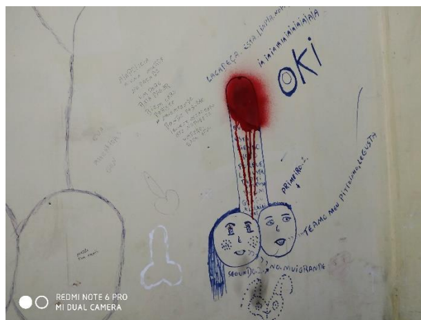
Dibujos y anotaciones de ECA

A Hrs. 19:00 aproximadamente, se procedió a tomar testimonios en las celdas de varones, espacios aún más reducidos (2x2 m aprox.), y con mayor hacinamiento, pues en una celda habían ocho personas y no existían ni colchones, ni catres, solamente frazadas sobre el suelo: