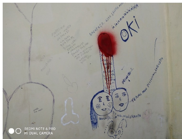
Dibujos y anotaciones de ECA

A Hrs. 19:00 aproximadamente, se procedió a tomar testimonios en las celdas de varones, espacios aún más reducidos (2x2 m aprox.), y con mayor hacinamiento, pues en una celda habían ocho personas y no existían ni colchones, ni catres, solamente frazadas sobre el suelo: