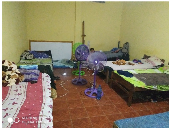
Dormitorio policial acomodado como celda de detención de 8 policías imputados

A Hrs. 19:45 aproximadamente, se procedió a tomar testimonios en los dormitorios policiales, adecuados para servir como celdas de los 8 servidores policiales imputados en el proceso de violación de la peticionaria. Si bien dicho espacio era mucho más grande que las celdas de la población común (8x4m. Aprox.), contaba con 6 catres y 2 colchones, y varios ventiladores, de todos modos es caliente y huele mal.