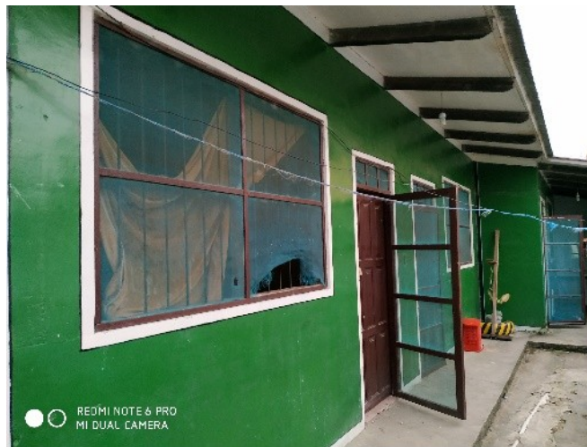
Exterior de la celda de mujeres.

pusieron. (...) con lo que ha pasado (...) a raíz de la denuncia de E.C.A., entonces es entendible que todos los policías, hombres y mujeres estén molestos o estén susceptibles de todo lo que pueda pasar. Con lo que han puesto más reglas, mayor seguridad, algunas nos decían, apúrense en el baño que no es toda la tarde, digamos, cuando siempre acostumbramos a bañarnos y hacer nuestras necesidades, ¿no? Después un rato de eso le dije a mi amiga “apúrate, que no es toda la tarde” (...) Ya con eso la policía se alteró. “Se está haciendo la burla de la policía cuando le dijo así”. Entonces le dije que no, que estábamos bromeando, que podíamos reír y me callé, ella siguió hablando, me callé para no alterar más la situación porque me puse a pensar que es entendible que ellos (...) Sólo me decía ella [la peticionaria] que la maltrataban, que estaba un año y otras cosas más pero nunca me dio nombres. Nunca me dijo, me siento así, asá. A raíz de eso ella habló, lo hizo público y yo, cuando vienen las visitas recién me entero qué es lo que ha pasado (...) E.C.A es un poco reservada también en sus cosas, me dice ella “No te voy a contar, porque de repente tú lo cuentas, porque sólo yo sé lo que es sufrir, tú no sabes nada, tú no sabes nada. Solo yo sé lo que he sufrido y esperé el momento en que yo pueda decir toda la verdad y que se haga justicia para mí”. Es lo único que ella me dice.” 2