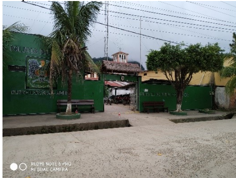
Frontis del Comando de la Policía de Rurrenabaque.

El 16 de marzo del año en curso, personal de la Defensoría del Pueblo, se constituyó en el Comando de la Policía de Rurrenabaque con el objetivo de obtener testimonios sobre los hechos investigados en el presente caso.