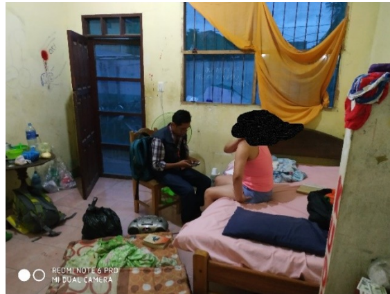
Celda de mujeres

DEFENSORÍA DEL PUEBLO ESTADO PLURINACIONAL DE BOLIVIA